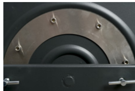
Tarcza hamulcowa ze stali nierdzewnej