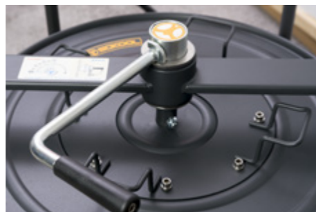
Mechanizm sprzęgła korbowego