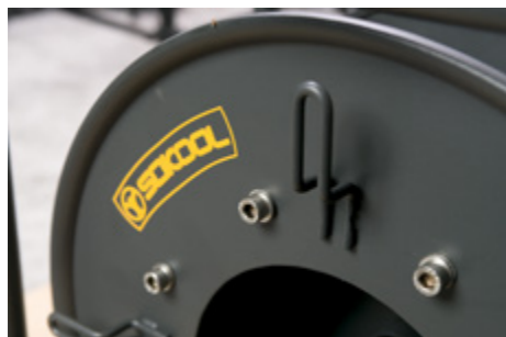
Łapy na rozbiegówkę przewodu